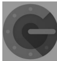
Google Authenticator – App...

Android Mobiles Google Authenticator App