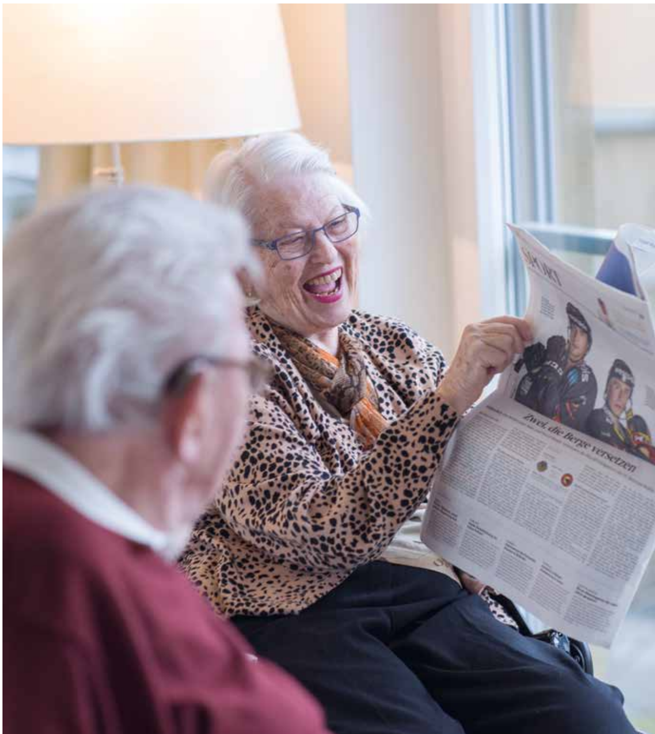
Viele Menschen über 80 Jahre leben noch selbstständig – deshalb ist es umso wichtiger, dass die Lebensfreude auch bleibt, wenn der Weg ins betreute Wohnen führt.