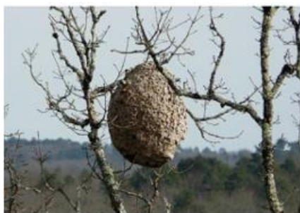
Abbildung 2: Nest in Baumkrone