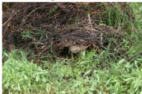
Abbildung 1: Vornest im Frühling http://www.hornissenschutz.ch/vespa-velutina-nth.htm

Um die Ausbreitung der Asiatischen Hornisse zu verhindern, ist eine möglichst frühe Erkennung der Ansiedlung notwendig. Dabei sind die Behörden auf Meldungen von Personen, die sich viel im Offenland und im Wald aufhalten, angewiesen. Im «Informationsblatt zur Wespen-Identifizierung» Wespen-Identifizierung Vespa velutina (mnhn.fr) und im Merkblatt des Bienengesundheitsdienstes 2.7. asiatische_hornisse.pdf (bienen.ch) sind die zur Identifikation notwendigen Informationen enthalten. Die Königinnen bauen im Frühling kleine Vornester an einer geschützten Stelle. In den Sommermonaten werden die grossen Nester in den Kronen von Laubbäumen erbaut. In den Wintermonaten sind die verlassenen grossen Nester mit seitlichem Einflugloch dank der Laubfreiheit gut in den Baumkronen zu erkennen.