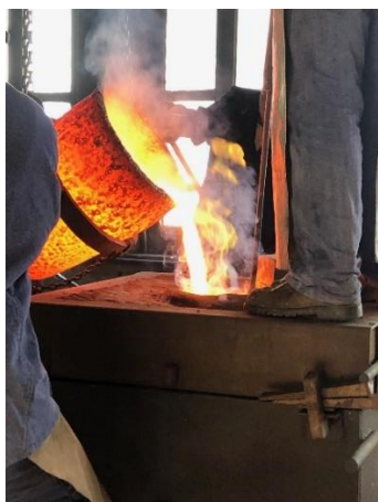
Glockenguss aus dem über 1000° heissen Tiegel.

Es war ein eindrückliches Erlebnis, doch wir möchten dem Ärpslizeller nicht vorgreifen!