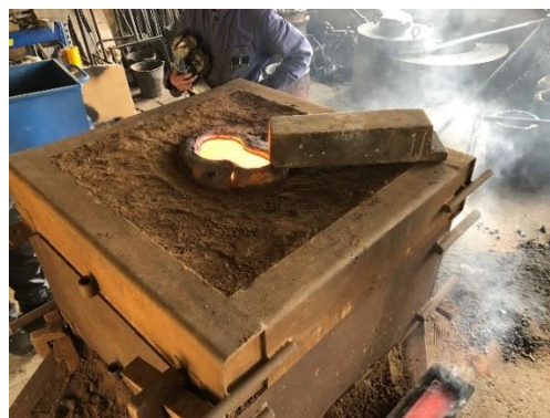
«Kuchenform» mit unserer frischgegossenen Glocke

Am Freitag 28. Mai 2021 wird sie in unseren Glockenturm montiert. Zuschauer sind willkommen!