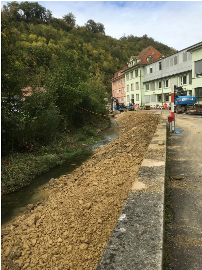
Ribigasse aus Richtung Kirchgasse Aufschüttungen zur Kanalisierung und Abstützung