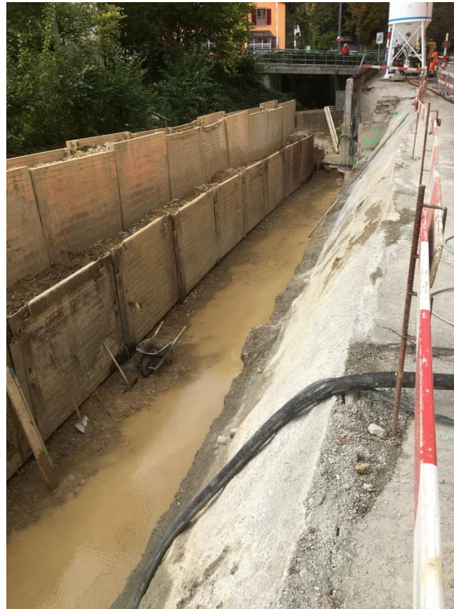
Ribigasse auf Höhe Oris Spundwände zur Ablenkung des Bachwassers