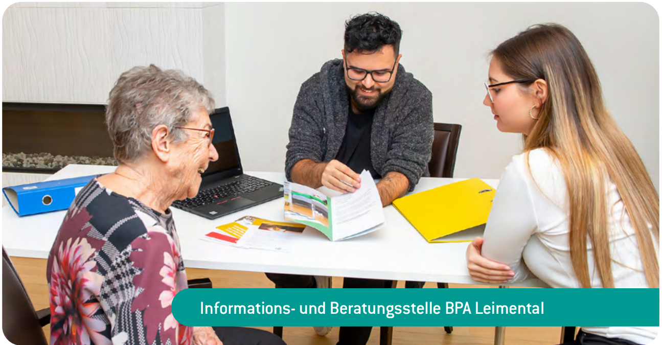
Informations- und Beratungsstelle BPA Leimental