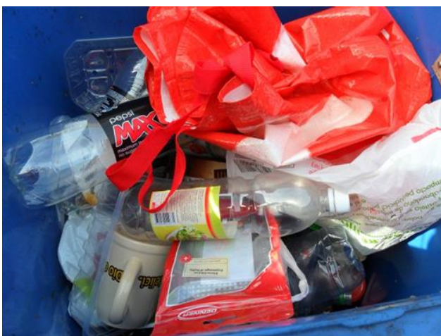
Diese Gegenstände befanden sich im Altölbehälter.