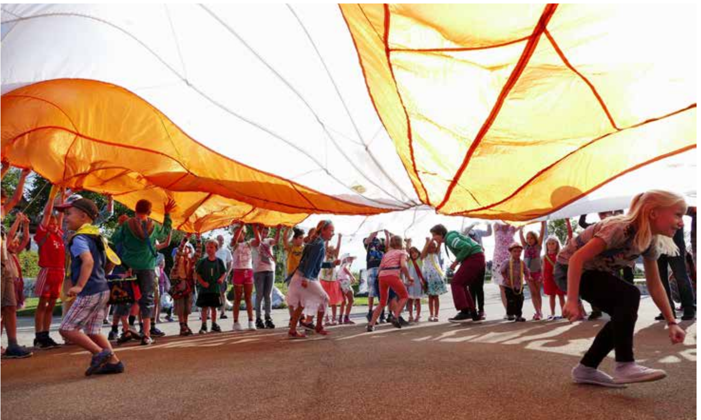
1. Schultag nach den grossen Ferien