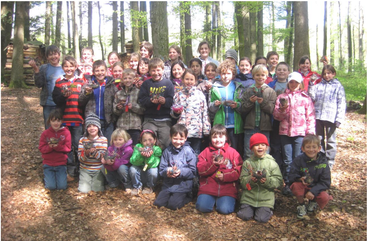
Die Primarschulkinder nach der Suche der Osternestli kurz vor Beginn der Osterferien.