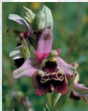
Hummel-Ragwurz - eine seltene Orchideenart