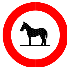
2.12 Verbot für Tiere