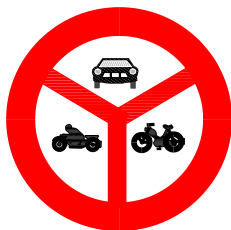
2.14 Verbot für Motorwagen, Motorräder und Motorfahrräder