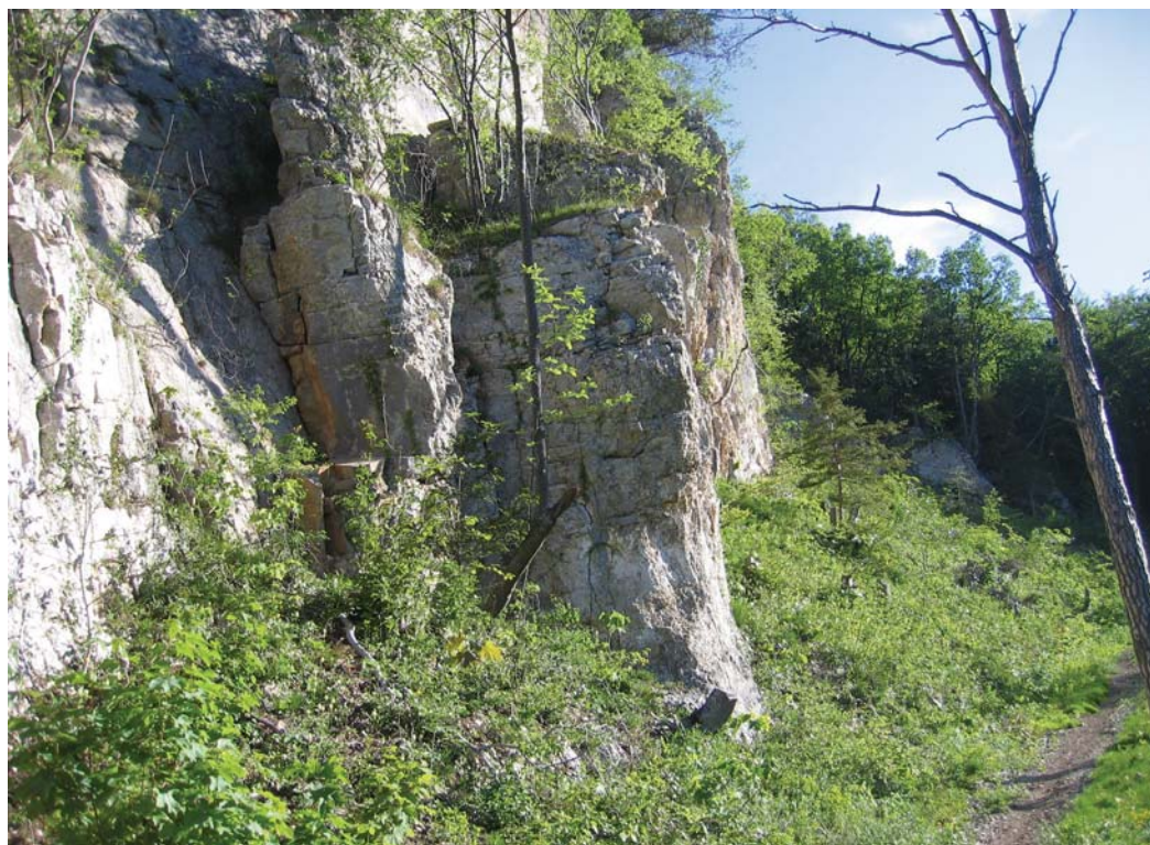
Wertvoller Felsbereich im Waldareal. Unterschutzstellung und Auflistungsmassnahmen für Reptilien und Orchideen konnten durch das Programm Naturschutz im Wald sichergestellt werden.

sich die Vorlage bei der vorbereitenden Landratskommission. Es bleibt zu hoffen, dass damit die bisherigen, erfolgreichen Naturschutzbemühungen im Waldareal fortgesetzt werden können.