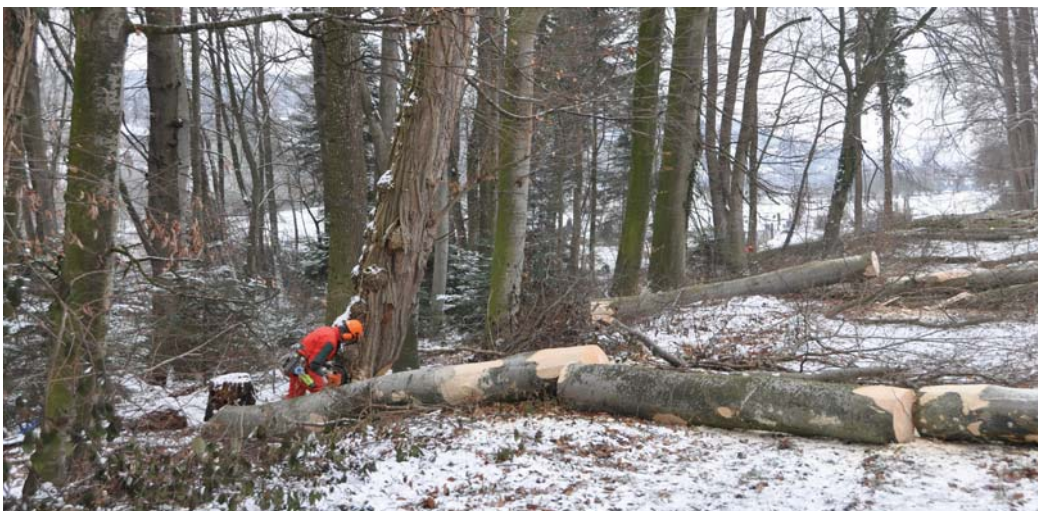
Überlegtes Arbeiten, wie bei der Waldrandpflege in Therwil, hilft Unfälle vermeiden.

Die Unfallverhütung im Wald hat nichts an ihrer Brisanz verloren, ganz im Gegenteil. Denn seit Februar 2008 ereigneten sich in Schweizer Forstbetrieben acht tödliche Unfälle, sechs davon alleine zwischen November 2008 und Januar 2009. Einer davon ereignete sich im Forstrevier Bennwil. Kein Wunder, dass die SUVA Alarm schlägt und Regeln für sicheres Arbeiten im Wald vorlegt. Gleichzeitig stellt sich grundsätzlich die Frage, ob die Waldarbeit gefährlicher geworden ist?