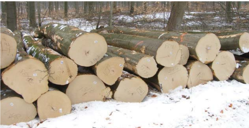
Buchenstammholz: Sinkende Nachfrage und Preise