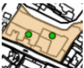
Wärmeverbunde (Wärmeverbund- kataster)