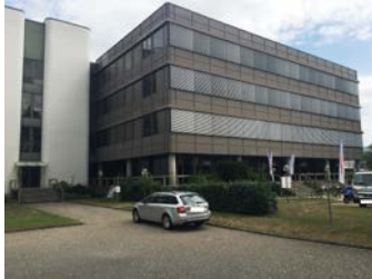
Pfeffingerring 201 Aesch

Das Hauptgebäude der Steuerverwaltung Rheinstrasse 33 in Liestal wird einer Gesamtanierung unterzogen. Für die Sanierungsphase, welche etwa ein Jahr dauern soll, musste das Gebäude vollständig geräumt werden. Die Arbeitsplätze der rund 90 betroffenen Mitarbeitenden befinden sich ab Montag, 5. November 2018, am Pfeffingerring 201 in Aesch.