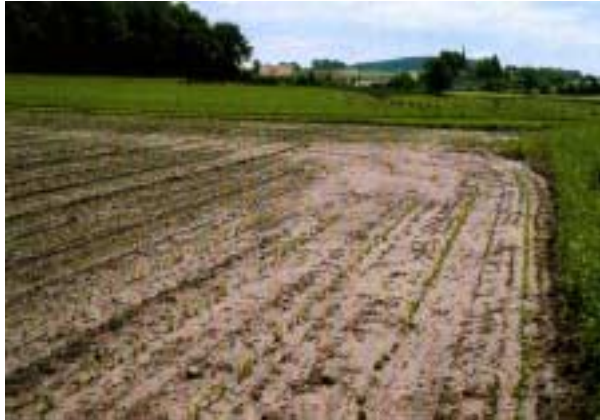
Abb. 5: Flächenerosion in einem Maisfeld (v.a. Verlagerung von Feinerde innerhalb der Parzelle).