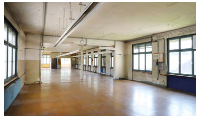
Verschiedene Räume des ehemaligen Spilag-Gebäudes im Norimatt-Quartier, das als Baubüro und für Infoveranstaltungen genutzt werden wird.