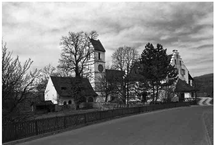
17 Kirche, Pfarrhaus und Pfarscheune