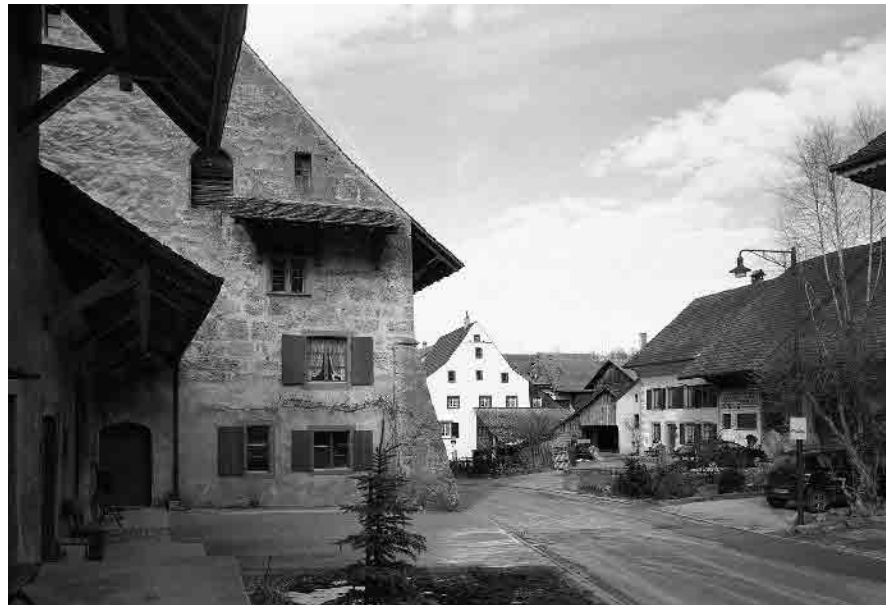
5 Das «Grosse Haus», 1613 erwähnt