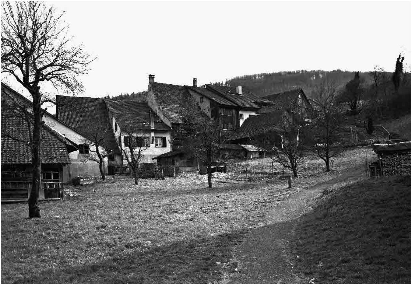
15 Aufstieg zum Kirchhügel