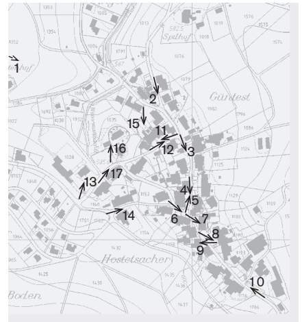
Plangrundlage: Übersichtsplan UP5000, Geodaten des Kantons Basel-Landschaft, © Amt für Geoinformation des Kantons Basel-Landschaft Fotostandorte 1: 10 000 Aufnahmen 2003: 1–23