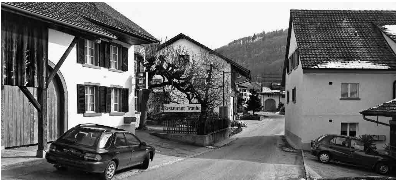
2 Nördlicher Eingang ins Strassendorf