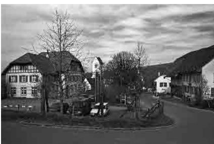
13 Schule am Kirchbezirk