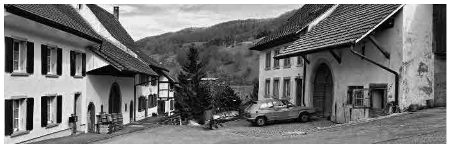
14 Ehem. Gasthof «Hirschen»