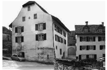
9 Obere Mühle