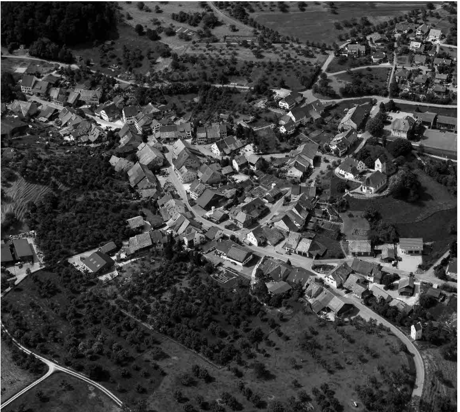
Flugbild Bruno Pellandini 2006, © BAK, Bern

Eines der schönsten ländlichen Ortsbilder im Kanton. Von mächtigen Massivbauten gefasster, sanft schwingender Strassenraum mit Weitungen, Nischen und Verengungen. Ummauerter Kirchenbezirk von grosser Fernwirkung in unverbauter Landschaft.