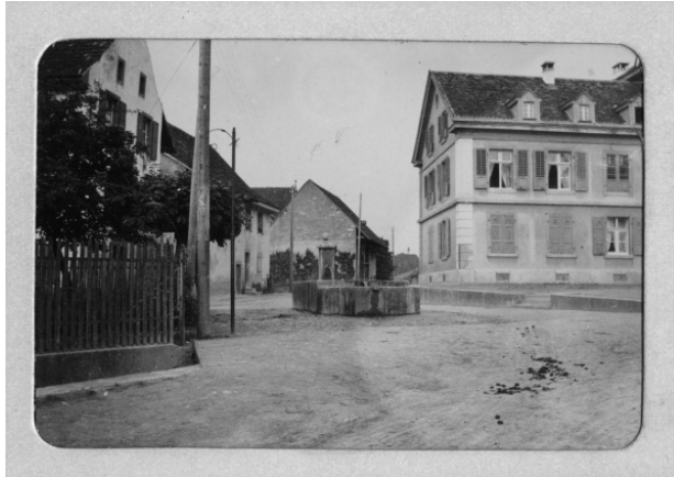
Dorfbrunnen Pratteln, 1905