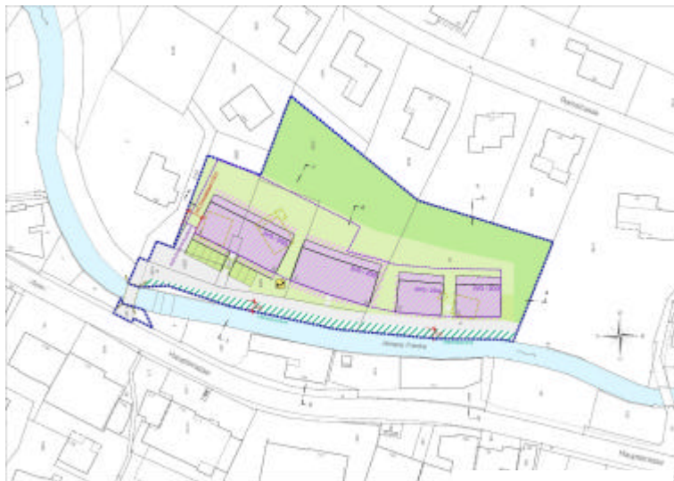
Auszug aus Quartierplan Nr. 1

Im Jahre 1994 wurde die erste Quartierplanung Frenke von der Gemeindeversammlung beschlossen und vom Regierungsrat genehmigt. Der Quartierplan Frenke beinhaltet den Bau von vier grossen Mehrfamilienhäusern mit gesamthaft 32 Wohnungen. Die Gebäude waren zusammengebaut und schnitten das steile Gelände stark an. In einer zweistöckigen Einstellhalle wurden genügend Parkplätze zur Verfügung gestellt.