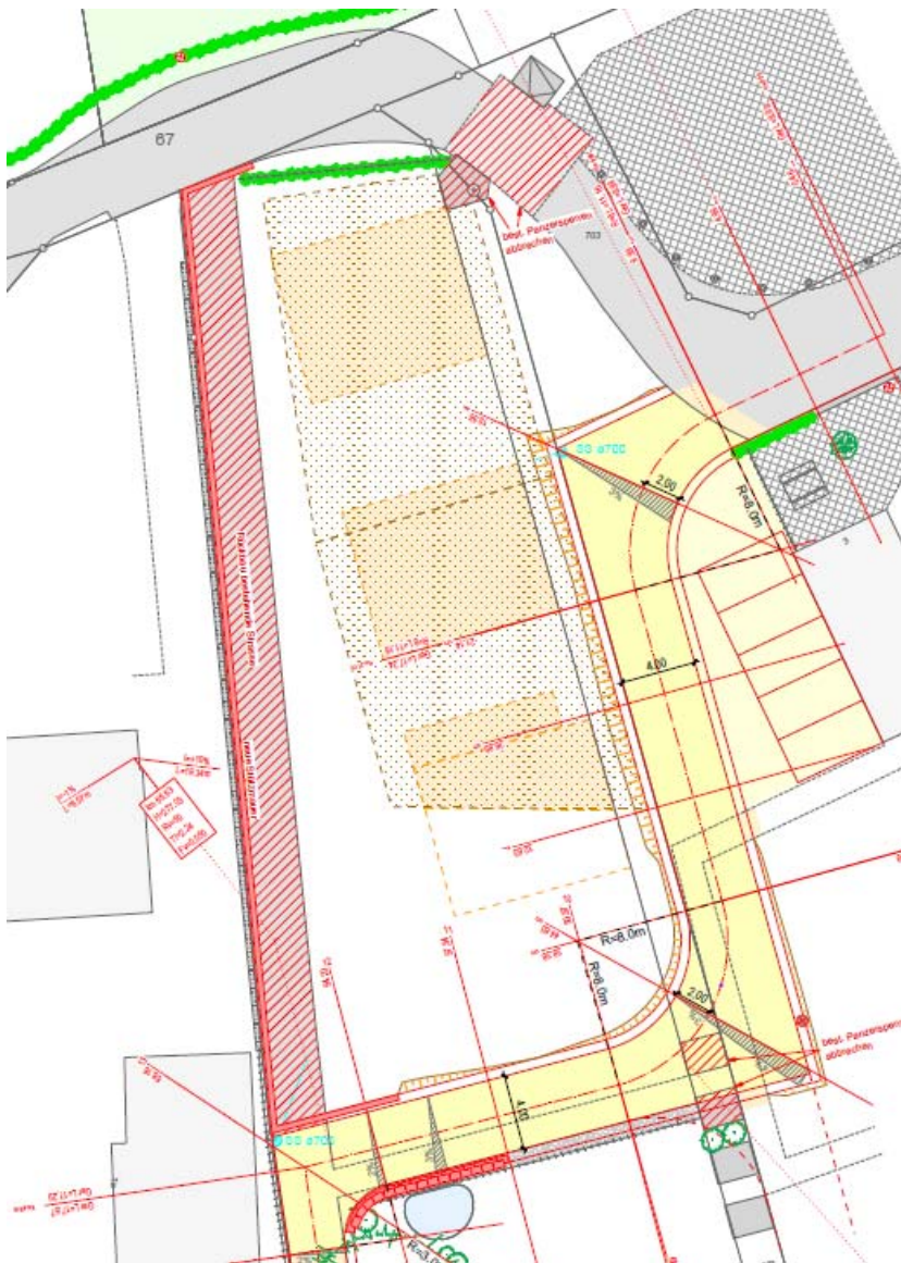
Erschliessungskonzept „Aurora“ (Strassenbau)

Die detaillierten Pläne für den Strassenbau und die Werkleitungen liegen zur besseren Ansicht, vorgängig zur Gemeindeversammlung, auf der Verwaltung auf.