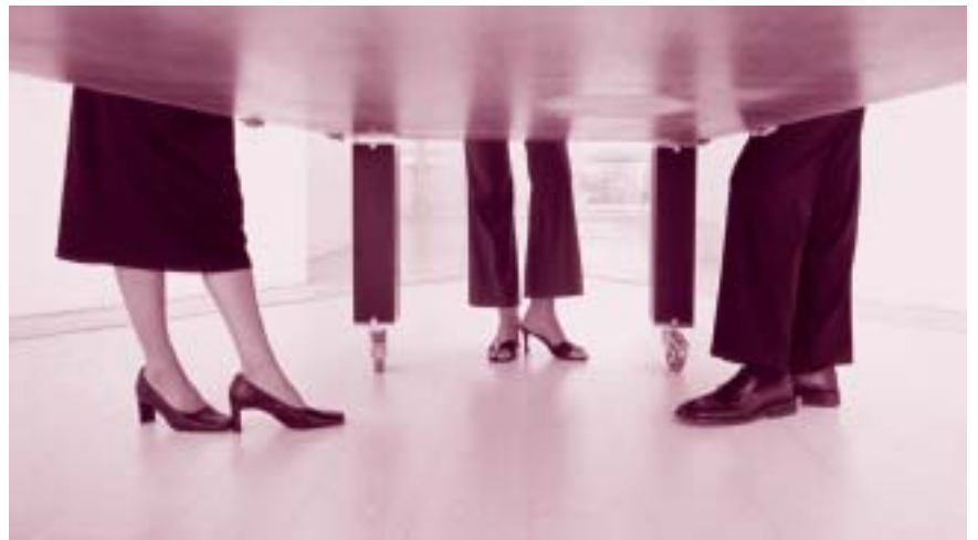
Mit Highheels oder Flachschuhen auf dem Weg zur Gleichstellung