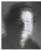
«Feuerwehrverband Viola».