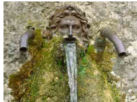
... FLIESSEND ...