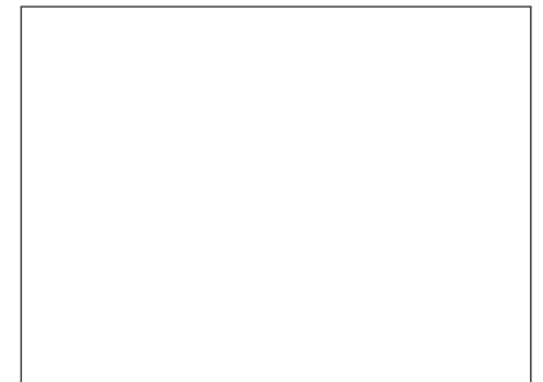
... ??? ...