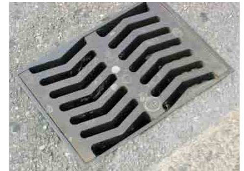
... VERSTECKT ...