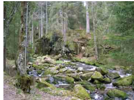
... NATURNAH ...

WASSER HAT VIELE GESICHTER FOTOGRAFIERE SIE UND MACHE MIT BEI UNSEREM FOTOWETTBEWERB