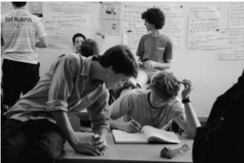
Die Sekundarstufe II umfasst im wesentlichen die Fachmittelschulen, die Berufsfachschulen, die Berufsmaturitätsschulen und die Gymnasien.

Mit dem Studienjahr 2009/10 wird sich auch der Studiengang Sekundarstufe II im Rahmen der Neuausrichtung der PH-Studiengänge wandeln. Die Veränderungen zielen in Richtung Konzentration und Fokussierung des erziehungs-, fachwissenschaftlichen und berufspraktischen Lehrangebots, wobei rein umfangmässig keine substanziellen Änderungen eintreten werden. Der bisherige Wahlstudienanteil wird in drei Richtungen hin gestaltet. Das erziehungswissenschaftliche Lehrangebot wird in Zusammenarbeit mit dem Institut Sekundarstufe I deutlich ausgeweitet. Die fachdidaktische Forschung am Institut wird in Lehrveranstaltungen in die Berufsausbildung integriert und neu wird die Berufspädagogik ein Teil des Lehrangebots.