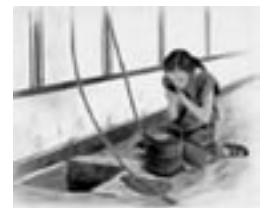
© Augusta Raurica Aquarell Fanny Hartmann, SJW-Verlag, Zürich