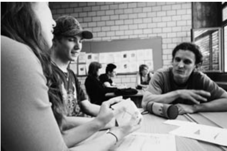
Die Sekundarstufe I benötigt fachlich kompetente, motivierte und verantwortungsbewusste Lehrpersonen.

Das Curriculum des Studiengangs ist in die vier Fachbereiche Erziehungswissenschaften, Fachdidaktiken, Fachwissenschaften und berufspraktische Studien gegliedert, die jeweils durch Modulgruppen inhaltlich näher bestimmt sind. Diese Ausbildungslandschaft wird von Adressatengrup-