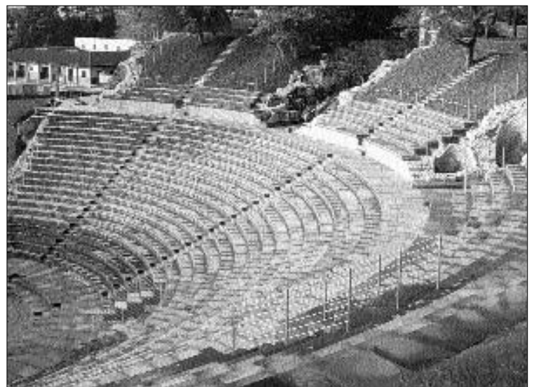
FAST WIE NEU Das Römertheater in Augst.

Die Eröffnungsveranstaltung findet bei jeder Witterung statt. Der Eintritt ist frei. Programm und Information: www.theater-augusta-raurica.ch