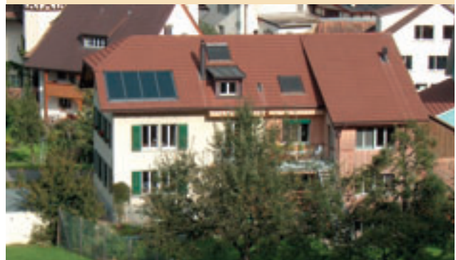
Mit Anreizen im Quartierplan werden Solaranlagen gefördert

In der folgenden Liste sind Beispiele von Anforderungen an ein Energiekonzept aufgelistet. Diese Beispiele müssen angepasst, ergänzt oder rekombiniert werden – je nach dem, was die konkrete Situation in der Gemeinde erfordert.