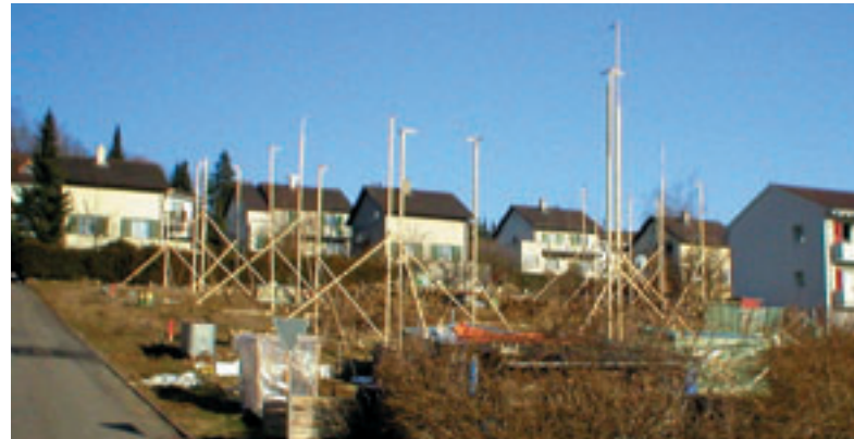
In der Ortsplanung spürt die Gemeinde den zukünftigen Energieverbrauch vor

Die Gemeinden sind in der Regel mit dem Instrumentarium der Raumplanung bestens vertraut. Deshalb orientiert sich auch dieser Leitfaden konsequent daran. Die Tipps und Empfehlungen sind auf die einzelnen Planungsebenen – also auf Leitbild, Richtplan, Zonenvorschriften, Quartierplan und weitere Instrumente – ausgerichtet. Dies hat für die Gemeindebehörden den positiven Nebeneffekt, dass sie auf jeder einzelnen Ebene Aspekte einer Energiepolitik einführen können, ohne gleich gezwungen zu sein, eine umfassende kommunale Energieplanung aufzustellen.