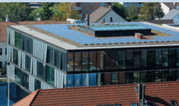
Politik nimmt Gestalt an: Solaranlage auf dem Dach des Gemeindezentrums Reinach BL

Vom Plan zur Nahwärmeversorgung – im Bild: Verlegung der Rohre in Anwil