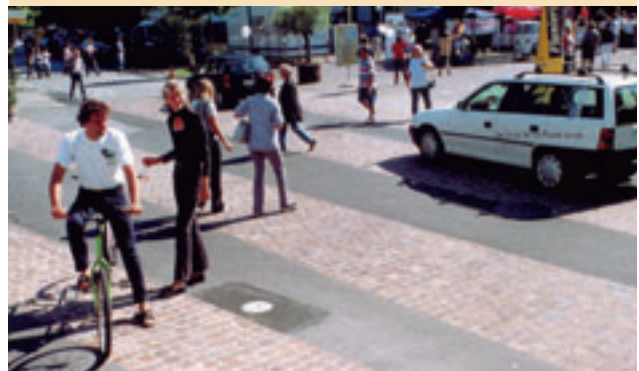
Miteinander statt Gegeneinander im Verkehr: Die Begegnungszone