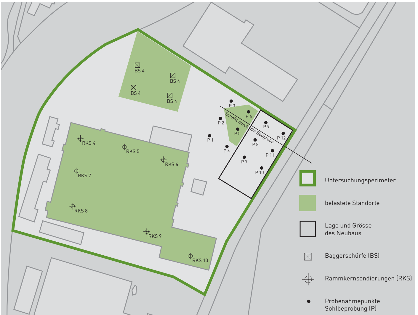
Abbildung 2: Situation nach Abschluss der Arbeiten und Rückbau von Gebäuden