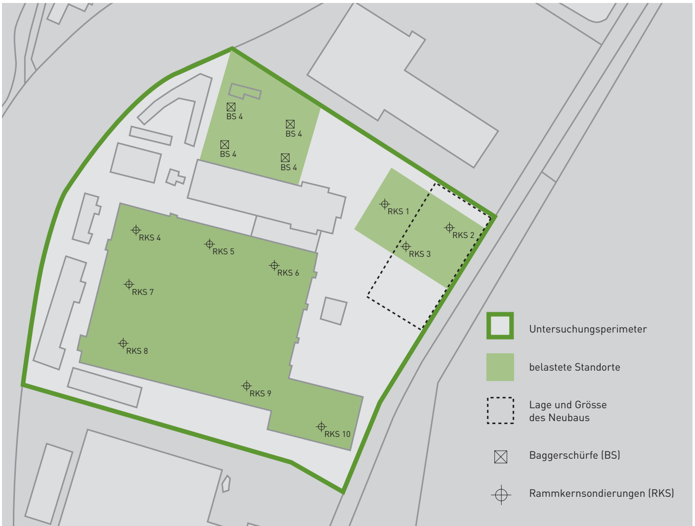
Abbildung 1: Situation vor Baubeginn