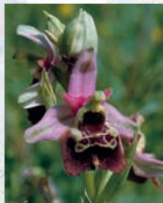
Hummel-Ragwurz - eine seltene Orchideenart